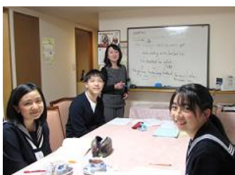
茅ヶ崎初級クラス