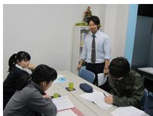
私立中高一貫・数学クラス