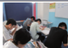
基礎から難関校受験対策