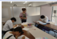
短期集中、終日実施の特訓