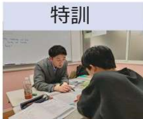
短期集中、終日実施の特訓