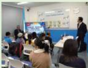
Azalea Reading Challengeの 開会式の様子です♪

多読・多聴IT教材はクラス内で使用するだけでなく、ご家庭でいつでも学習出来ます。 どこでも生徒のスマートフォン、タブレット、パソコンに入れて使用出来ます。 複数デバイスで使用できるので、電車に乗っている間や待ち時間のような隙間を楽しく埋めることも出来ます。