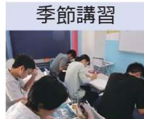
基礎から難関校受験対策